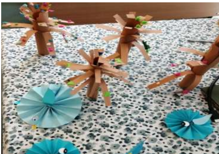
Madarak és fák napja.

Ezekhez kerestek kézműves technikákat, melyeket meg is valósítottak.