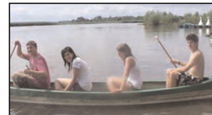
A sarudi táborban

Szociális érzékenyítő programjaink (+1 szendvics és más karitatív tevékenységek, "Élő Könyvtár", véradás) a másokért is felelős életre nevelnek.